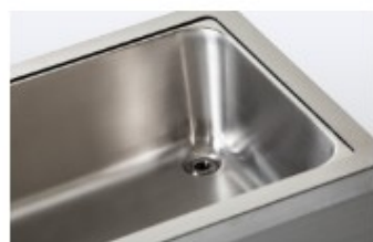
洗浄槽内排水口 例