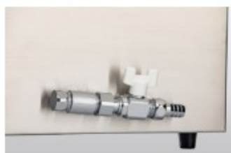
手動排水バルブ 例