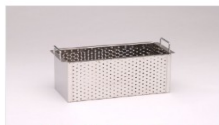
洗浄バスケット(孔径Φ3mm) [SP2005]

【ビーカーラックの使用上の注意】※ビーカーラックの荷重たわみ温度（℃）はJISK7191/1.80MPa条件で69℃です。ヒーターを使用する際は、本体槽が高温になるため、ビーカーラックの使用ができません。