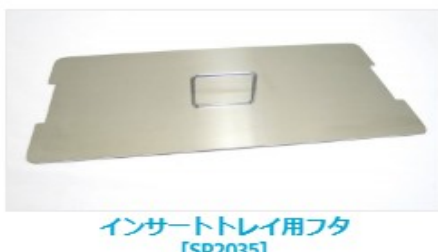
インサートトレイ用フタ [SP2035]