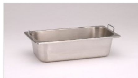
インサートトレイ[SP2025]