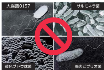
(財団法人日本食品分析センター調べ)