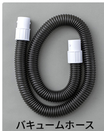
バキュームホース