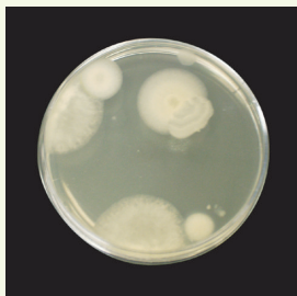
シルバーPH7ファースト 洗浄前