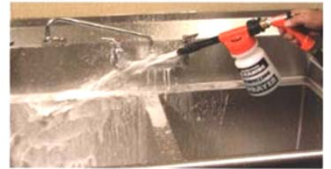
フォームノズル使用