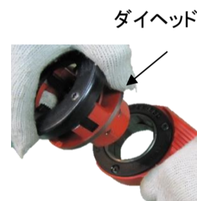
ダイヘッド ラチェット