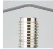
塩ビパイプの曲げ加工