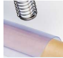
塩ビ板の曲げ加工