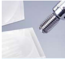
シュリンク包装の収縮