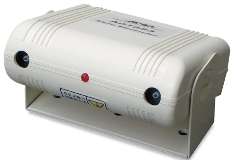
除電用イオン生成分布