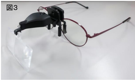
図3のようにクリップで奥まではさみ込み取り付けます。 レンズは角度調整可能です。(図4)