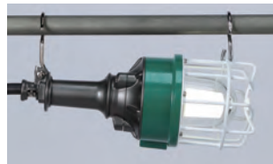
縦吊り・横吊りのできるWフック付