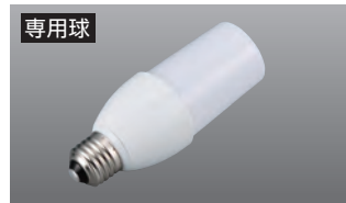
専用球 LDT11型11W LED電球 光の広がり/約300度