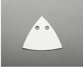
[EA809XK用]サンドペーパー(三角)