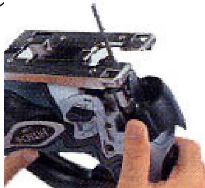
ブレード交換はレバー操作のみ